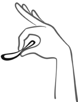
Abbildung 2 Drücken Sie GinoRing zusammen